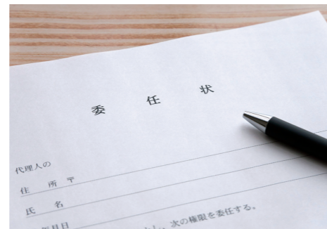
※写真・イラストはイメージです。