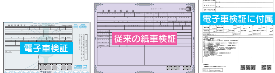
自動車検査証の写し